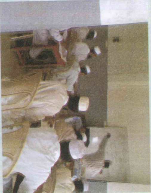
وليس يصبح في الأذهان شيء إذا احتاج النهار إلى دليل

ونوال، ومحضر ومنظر، وتقدير وتقدير، وترقيم وتقييم، وتخطيب وتجاوب، ومحادثة ومباحثة، ومحاكمة ومناقشة، وتفاعل وتبادل، وفحص ومحض، وتأثيل وتمثيل، وتصحيح وتنقيح، وتطبيق وتعميق، وتحقيق وتنقيح، وتدريب وتدريب، وإبداع وإمتاع، وإحسان وإفغان، وإجادة وإفادة. إنها أيام ليست كالأيام، أيام حلوة، سبعة وعشرون يوماً. إنها ساعات عبقرة، مائة واثنان وستون ساعة. أجل. هي جزء من حياتي لم ولن أنساه أبد الأبدين. وهو في الحقيقة غض، طري في حافطتي. أيام وساعات صرفتها في روضة الدبلوم في اللغة العربية الراقية مع أحباب ذوي أبصار والبواب. هي روضة أي روضة. يقضى منها العجب. قد رزق الله جل علاه أصحابي الذين تمرغوا معي فيها طبعاً سالماً وعقلاً سليماً ونكاهاً متوقفاً وفكراً نيراً وقلباً كبيراً ولساناً لساناً وشرفاً جسيماً وعلماً واسعاً وفيها عميقاً ورعباً دقيقاً ونطقاً صحيحاً وخلفاً كريماً. عاشت هؤلاء الأعزاء؛ قوم لا يشقى بهم جليسهم. أي أحبهم في الله. واستخرجت منهم بفضلهم سبحانه وتوفيقه عديداً من الدرر والجواهر والمرجين. وكل واحد منهم لؤلؤ فيه لآلئ، ووجه فيه جواهر، ومرجان فيه مرجان.