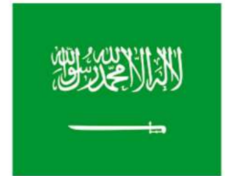
السلام الملكي السعودي