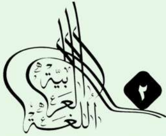
مؤتمر مكة الدولي الثاني للغة العربية وآدابها

خلال مؤتمرات مكة الدولية للغة العربية وآدابها (الأول - الثاني - الثالث - الرابع) تم عرض أكثر من (٣٠) مبادرة وتجربة ناجحة في مجال اللغة العربية قدمها كوكبة متميزة من الأكاديميين والمعلمين والمتخصصين والمهتمين بتعليم اللغة العربية من داخل المملكة العربية السعودية ومن خارجها وفق الشروط والضوابط المعلنة من قبل اللجنة المنظمة للمؤتمر، نوضح تفاصيل أعدادها في الجداول التالية: