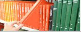
صورة ١٢: من مكتبة جامعة كنت ستيت

المراجع • زيادة تعلم الطلاب خارج كورس للتدريس. • جعل الوسائل جزءاً من عملية التعلم. • مشاركة الطلاب إنجازهم مع المجتمع. • التواصل للتدريس والتعلم (الطلاب ، أولياء الأمور ، المجتمع الكبير).