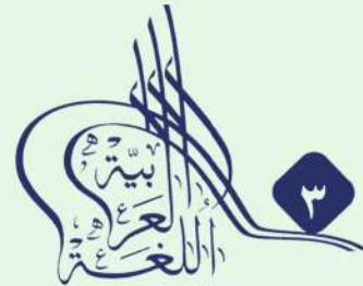
مؤتمر مكة الدولي الثالث للغة العربية وآدابها اللغة العربية والتواصل الحضاري