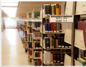
صورة ١١: الرفوف الكتب بمتاحف المكتبة في الولايات المتحدة الأمريكية

منهجية و أدوات البحث يتم تطبيق المشروع على طلاب المدارس المتوسطة و الابتدائية في المملكة العربية السعودية لمدة فصل دراسي / سنة كاملة. سيقدم هذا المشروع خطة تجوي على استراتيجيات محددة لمساعدة المعلمين على التركيز على مهارات الطلاقة في القراءة. سيكون تطبيق المشروع من خلال مراحل لتطبيق خطة العمل. تبدأ بالتحديد للمشكلة المستهدفة ثم التصميم لصياغة الخطة ثم التخطيط خلالها ثم التدريس حسب الاستراتيجيات المقترحة ثم التقييم للتأثير ومن ثم العودة إلى نقطة البداية لتجويد الخطة.