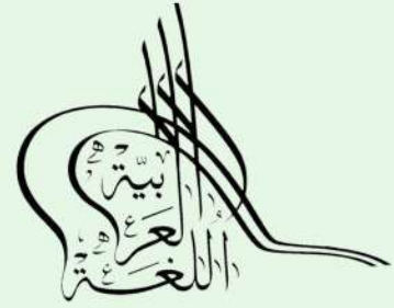
المؤتمر الدولي للغة العربية وآدابها