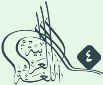
المؤتمر الدولي الرابع للغة العربية وآدابها الغة العربية والهوية