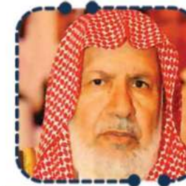
الدكتور عبدالله بن صالح العبيد

المركز التربوي للغة العربية لدول الخليج الإمارات العربية المتحدة