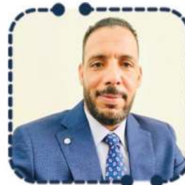
الدكتور محمد سلامي

جامعة زايد - الإمارات المملكة الأردنية الهاشمية