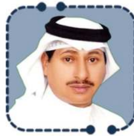
الدكتور عبدالرحمن بن محمد الزهراني

مركز إثراء المعرفة للمؤتمرات والأبحاث والنشر العلمي