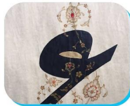
الخطاطه/ فاطمة ابراهيم الصرامي @Fa6mah24