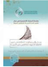
اللغة: العربية تاريخ الإصدار: 2021 م منشورات: الإيسيسكو المقاس: 24 x 17 عدد الصفحات: 94