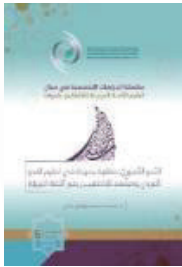
اللغة: العربية تاريخ الإصدار: 2021 م منشورات: الإيسيسكو المقاس: 24 x 17 عدد الصفحات: 102