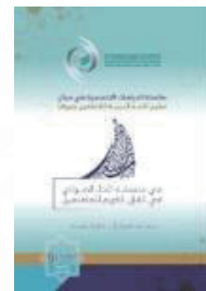
اللغة: العربية تاريخ الإصدار: 2021 م منشورات: الإيسيسكو المقاس: 24 x 17 عدد الصفحات: 132