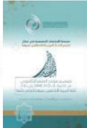
اللغة: العربية تاريخ الإصدار: 2021 م منشورات: الإيسيسكو المقاس: 24 x 17 عدد الصفحات: 100