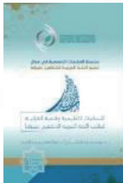
اللغة: العربية تاريخ الإصدار: 2021 م منشورات: الإيسيسكو المقاس: 24 x 17 عدد الصفحات: 84