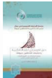
اللغة: العربية تاريخ الإصدار: 2021 م منشورات: الإيسيسكو المقاس: 24 x 17 عدد الصفحات: 88