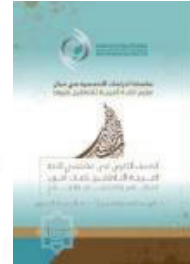
اللغة: العربية تاريخ الإصدار: 2021 م منشورات: الإيسيسكو المقاس: 24 x 17 عدد الصفحات: 118