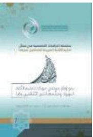
اللغة: العربية تاريخ الإصدار: 2021 م منشورات: الإيسيسكو المقاس: 24 x 17 عدد الصفحات: 100