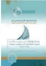
اللغة: العربية تاريخ الإصدار: 2021 م منشورات: الإيسيسكو المقاس: 24 x 17 عدد الصفحات: 106