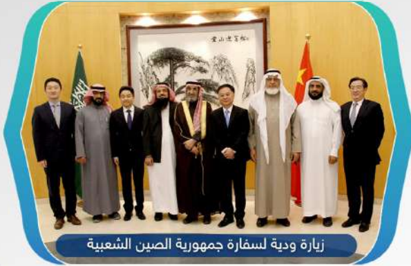
زيارة ودية لسفارة جمهورية الصين الشعبية