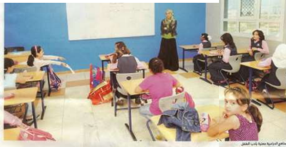
المنهج الدراسي متعدد آداب الطفل

في عصر إيماننا سلسلة بعنوان «تصنيف أعمال كبار الأدباء». فقامت بتصنيف أعمال تاليف الصيغ الميصرية لطلبة الأدب إلى أدب الأطفال الذي لا يزال البعض ينظر إليه نظرة دونية باعتباره أب من العجزة التلقائية. وكذلك لتغيير نظرة الآباء الذين يرون في شدة كتابة الأطفال هدراً للوقت. في حين أنهم لا يتدرون في شارة لغوية واستراتيجية ودولة الصنع. أو أهمية إكثورية لا تناسب من الطفل».