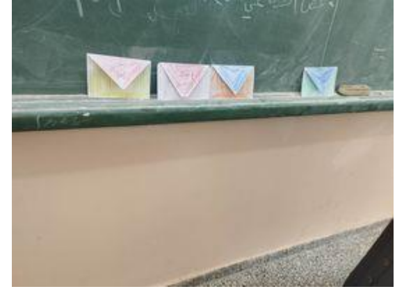
استراتيجية المراسل الصغير