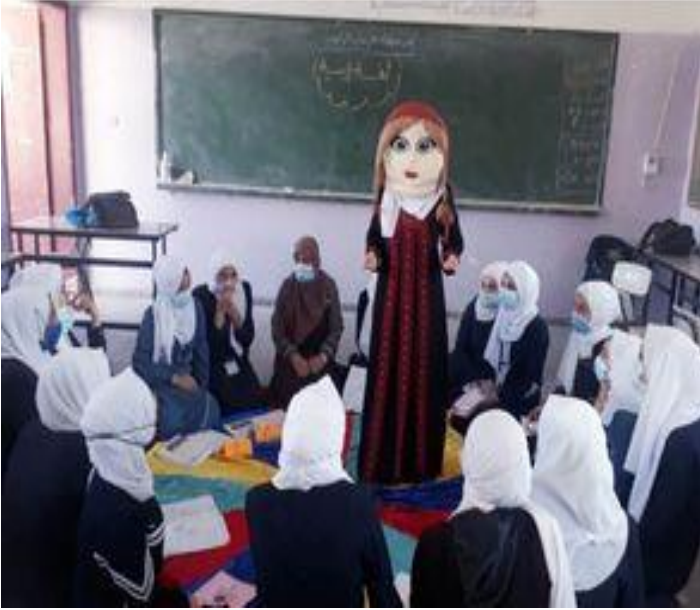
استراتيجية القصة باستخدام الدمى