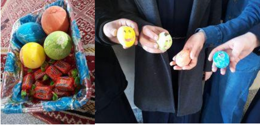
استراتيجية اكسر بيضة واربح