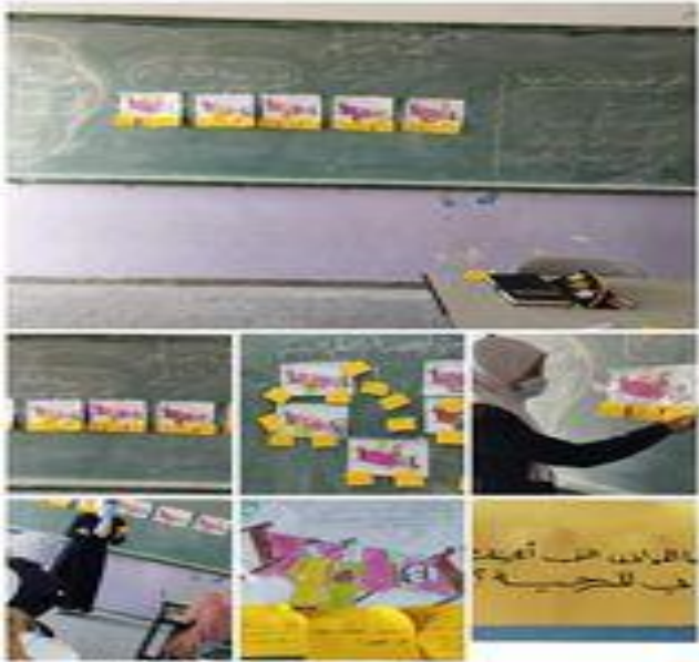
استراتيجية التعلم بالرسم