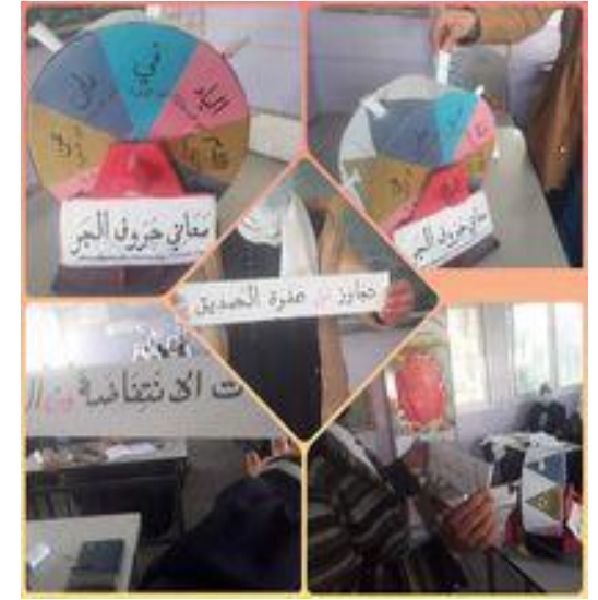
استراتيجية دوائر الحروف