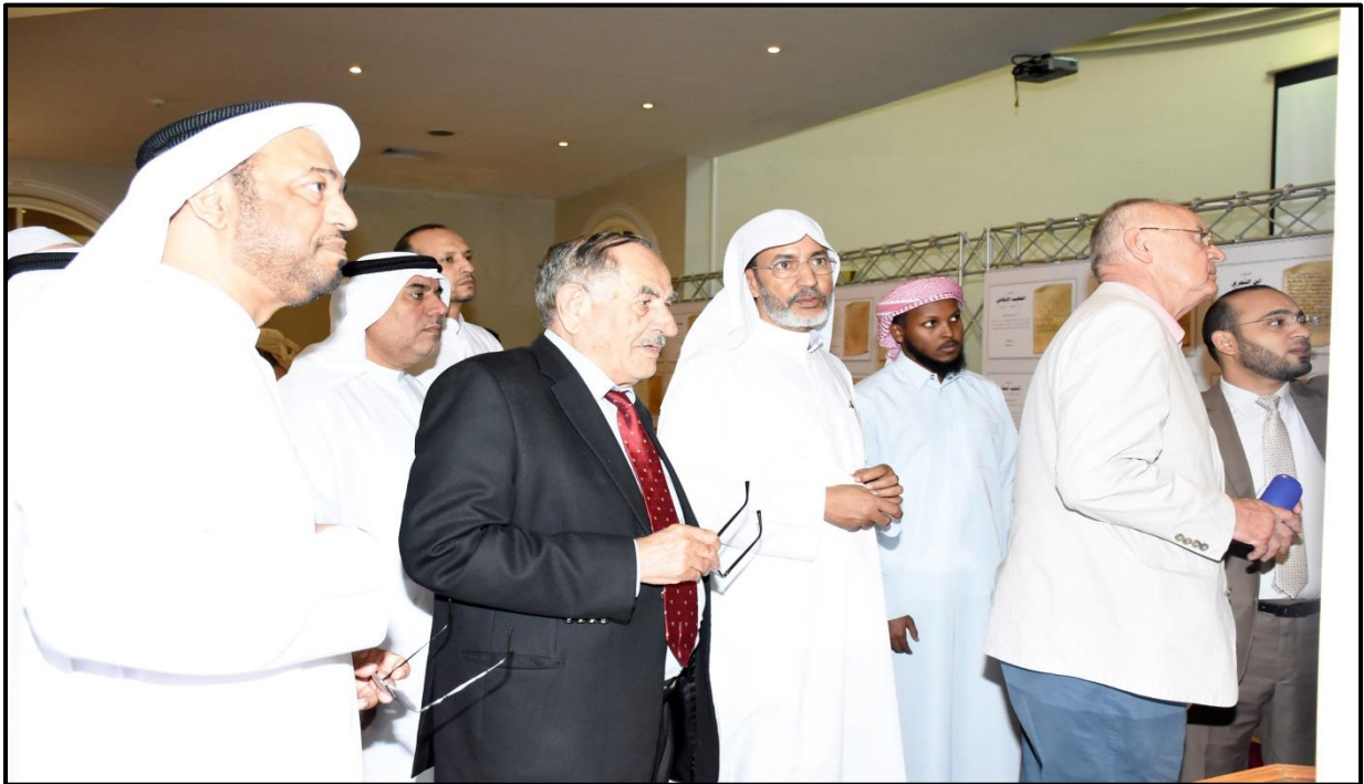
جانب من الاشراف والاعداد وافتتاح معرض خطوط المخطوطات العربية - الشارقة ٢٠١٧م