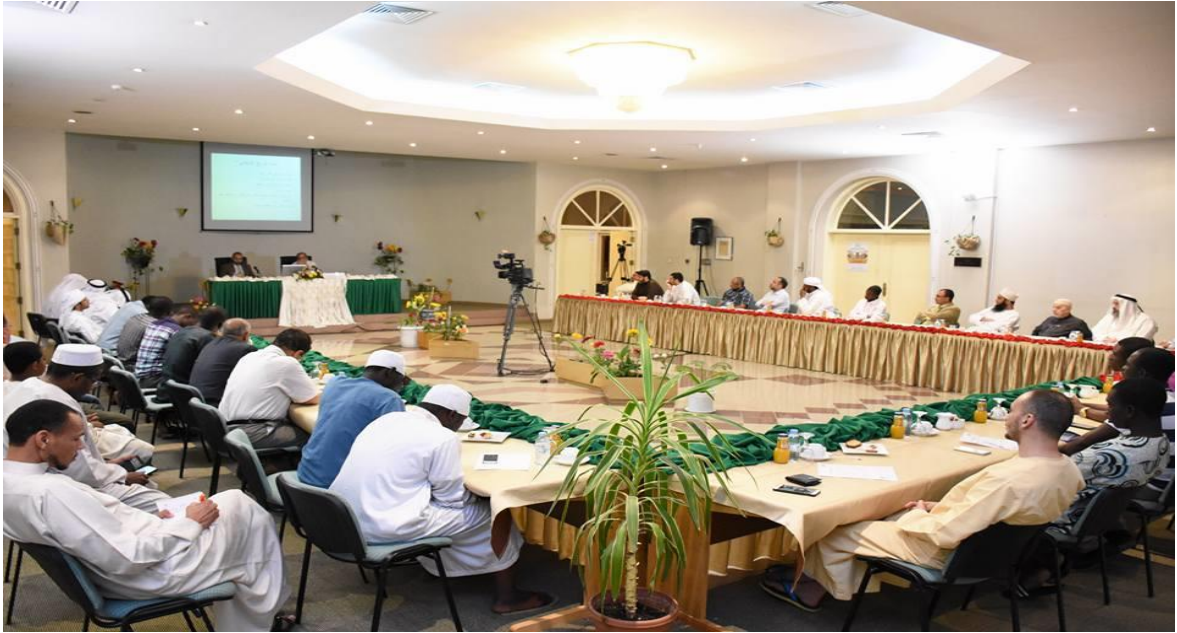
جانب من تقديم والقاء ندوة حول تاريخ التراث العربي - الشارقة دولة الامارات ٢٠١٧م