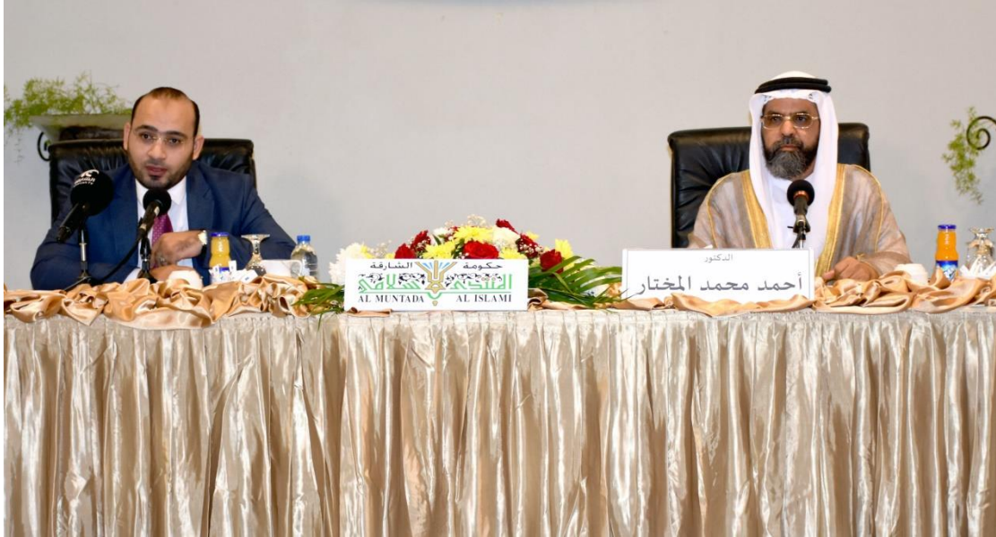
جانب من تقديم ندوة بعنوان ثقافة القراءة في مواد الدراسات الإسلامية - الشارقة دولة الامارات ٢٠١٧