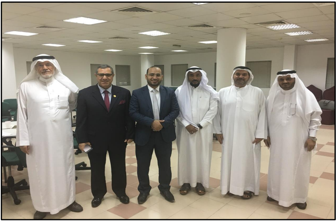
جانب من لقاء العلماء والمدربين بمركز الأمير عبد المحسن بن جلوي لمناقشة تحديات دراسات وعلوم اللغة العربية والثقافة الإسلامية في العصر الحديث - الشارقة ٢٠١٨م.