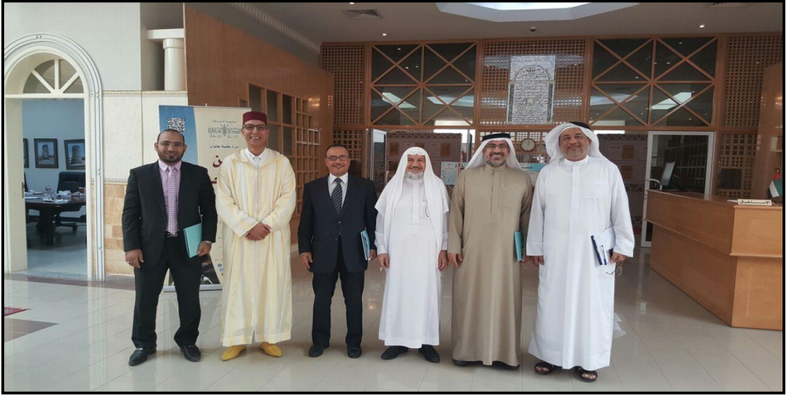
اجتماع اللجنة الاستشارية لوضع مساقات (دبلوم اللغة العربية) المنتدى الإسلامي- المشاركة دولة الامارات ٢٠١٨م