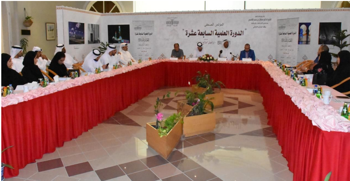
جانب من لقاءات الدورة العلمية الكبرى برعاية صاحب السمو حاكم الشارقة للتعريف بالدورة وبرامج اللغة العربية المصاحبة لها- ٢٠١٦- ٢٠١٩م