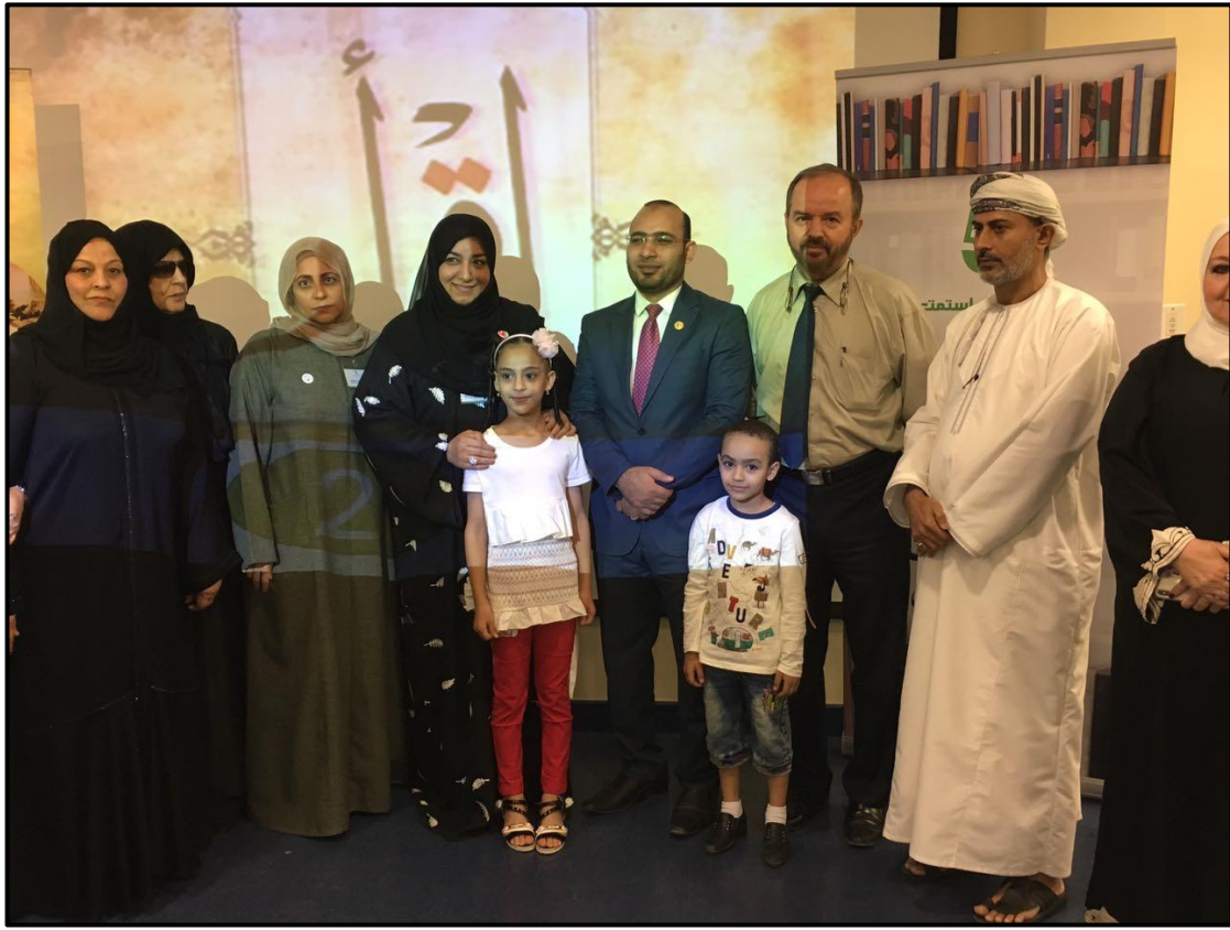
جانب من القاء دورة تدريبية( الهندسة الذهنية في القرآن الكريم واللغة العربية ) مركز اقرأ واستمتع - دبي - دولة الامارات ٢٠١٨م