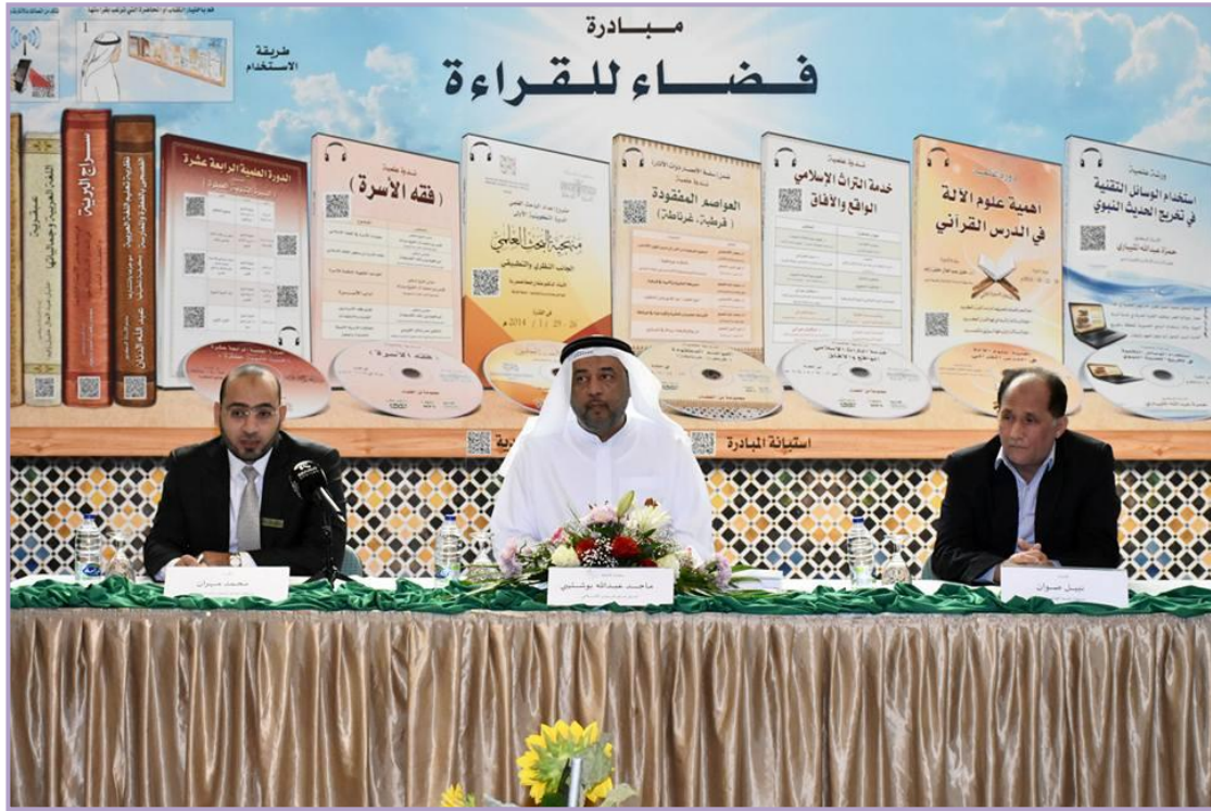
المؤتمر التعريفي بإطلاق مبادرة فضاء القراءة التقنية بالشارقة المنتدى الإسلامي- الشارقة دولة الامارات ٢٠١٦م