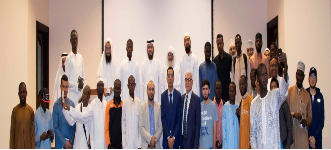
جانب من الاعداد والاشراف على ندوة المخطوطات والتراث العربي - الجامعة القاسمية - الشارقة ٢٠١٩