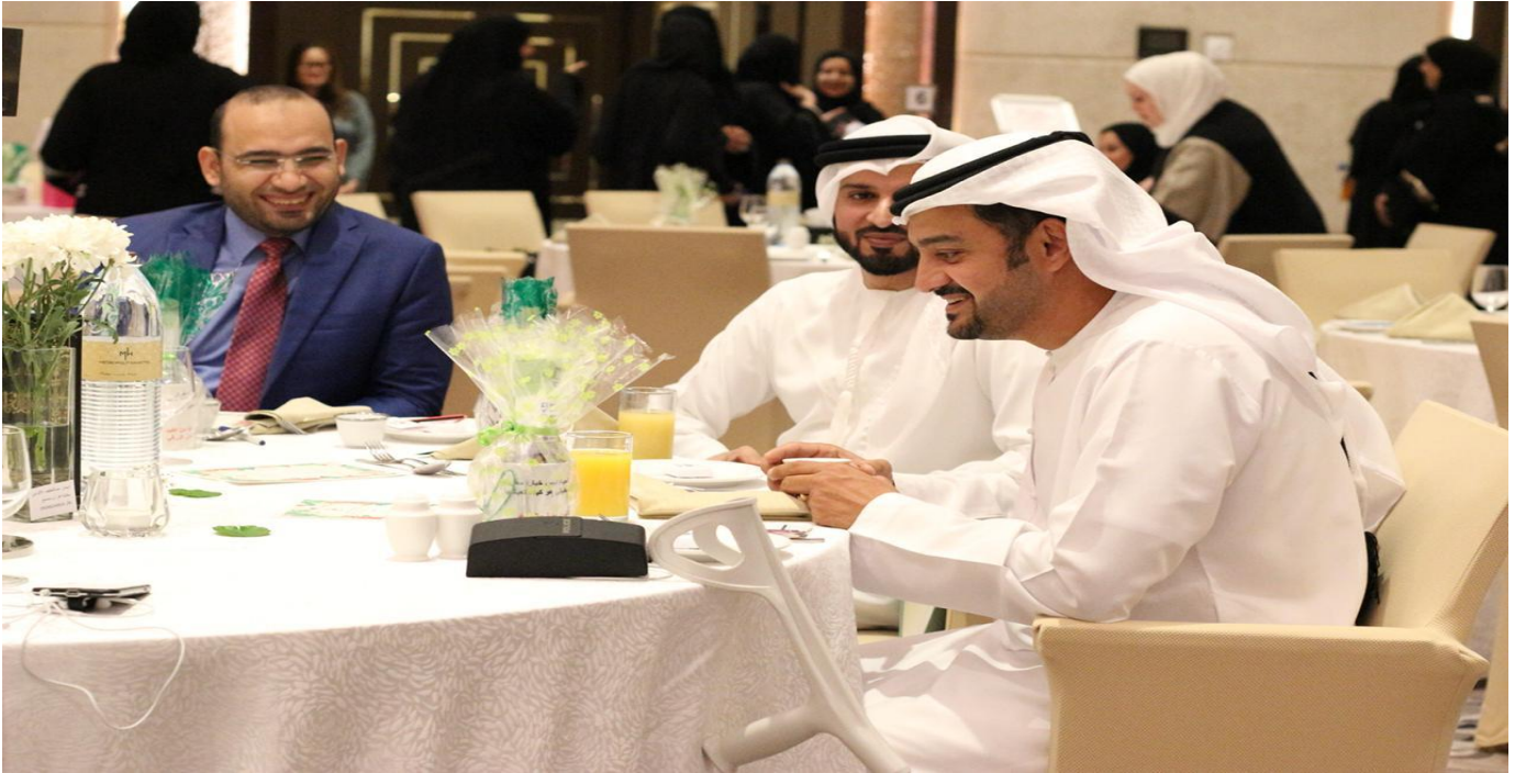
جانب من لقاءات واحتفالات مركز اقرأ واستمتع بمقدمي ومدربي دورات القراءة واللغة العربية - دبي - دولة الامارات ٢٠١٨م