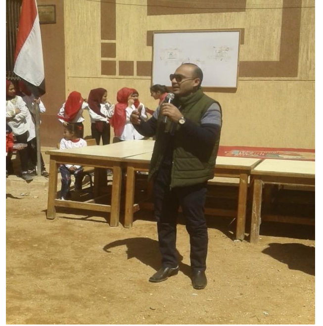
جانب من لقاء مدرسة الشيخ حسين الابتدائية وبرنامج ( أصدقاء الحروف العربية ) ٢٠٢٣م