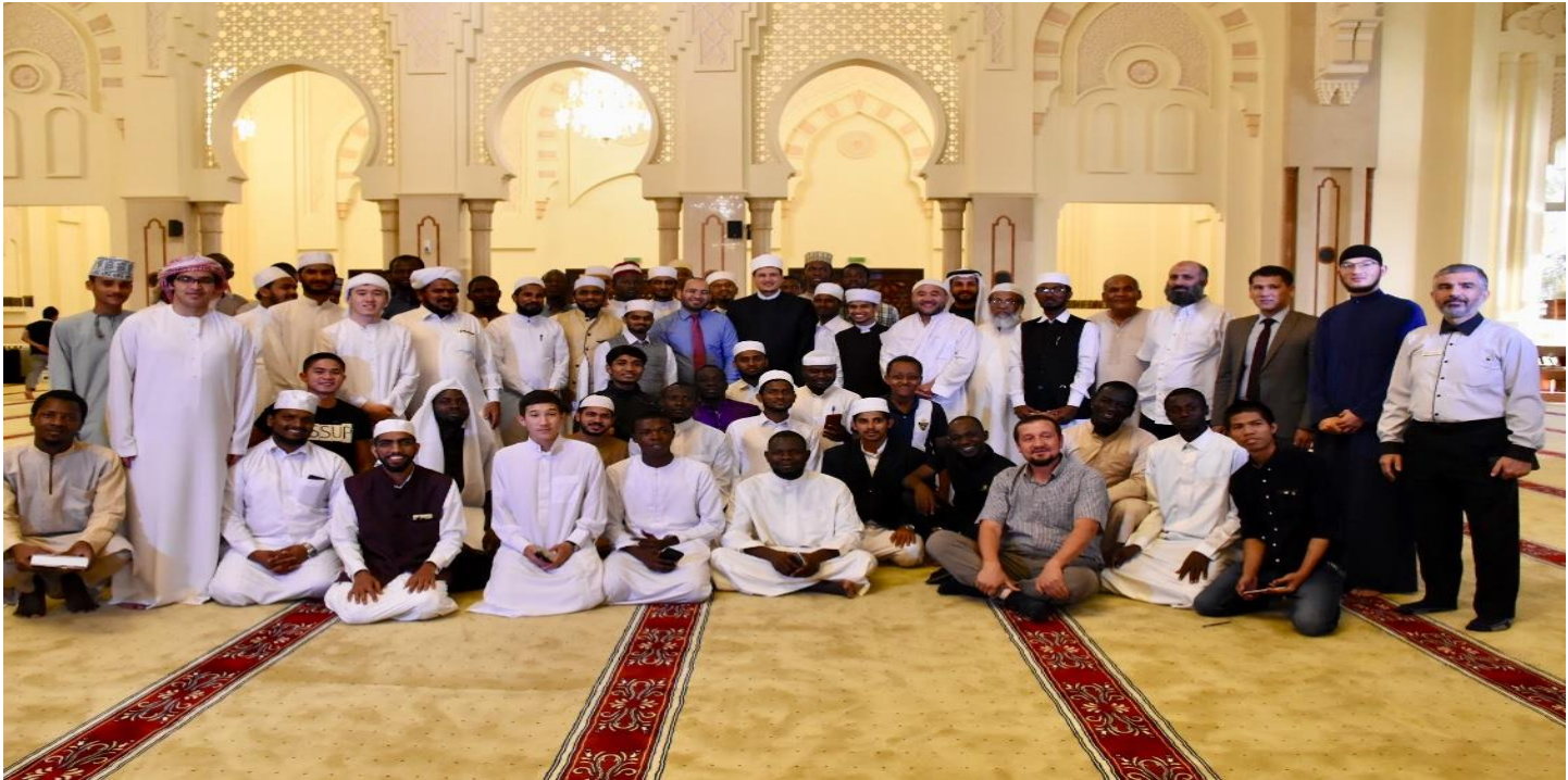
الاعداد العلمي واللغوي للدورة العلمية محكم التنزيل - والمصاحب لها برامج اللغة العربية - الشارقة ٢٠١٩م