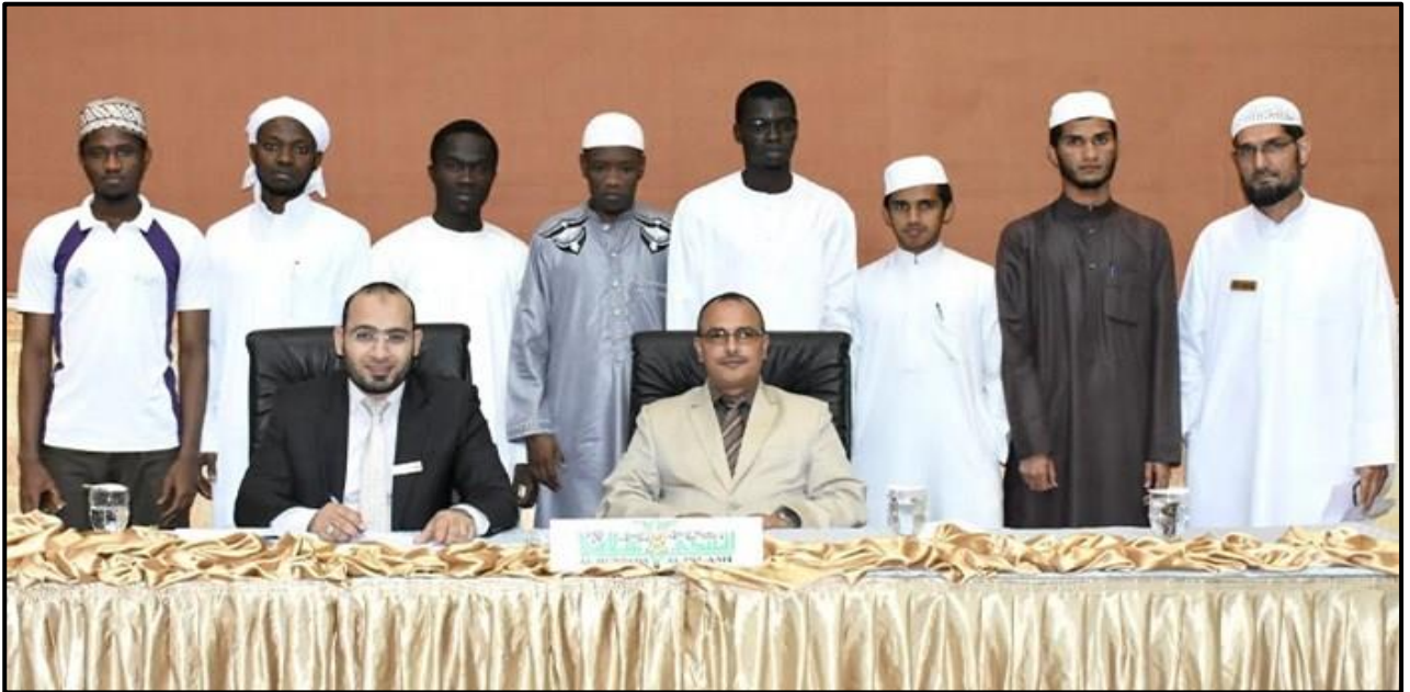
جانب من التحكيم في مسابقة اللغة العربية السنوية - طلاب الجامعة القاسمية - الشارقة دولة الامارات ٢٠١٧م