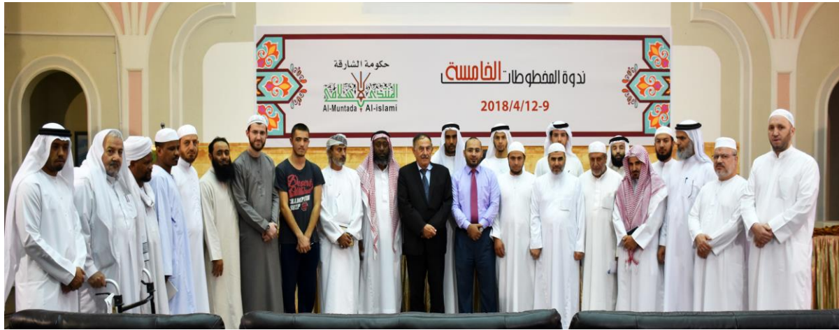
جانب من ندوة المخطوطات الخامسة - الشارقة دولة الامارات ٢٠١٨م