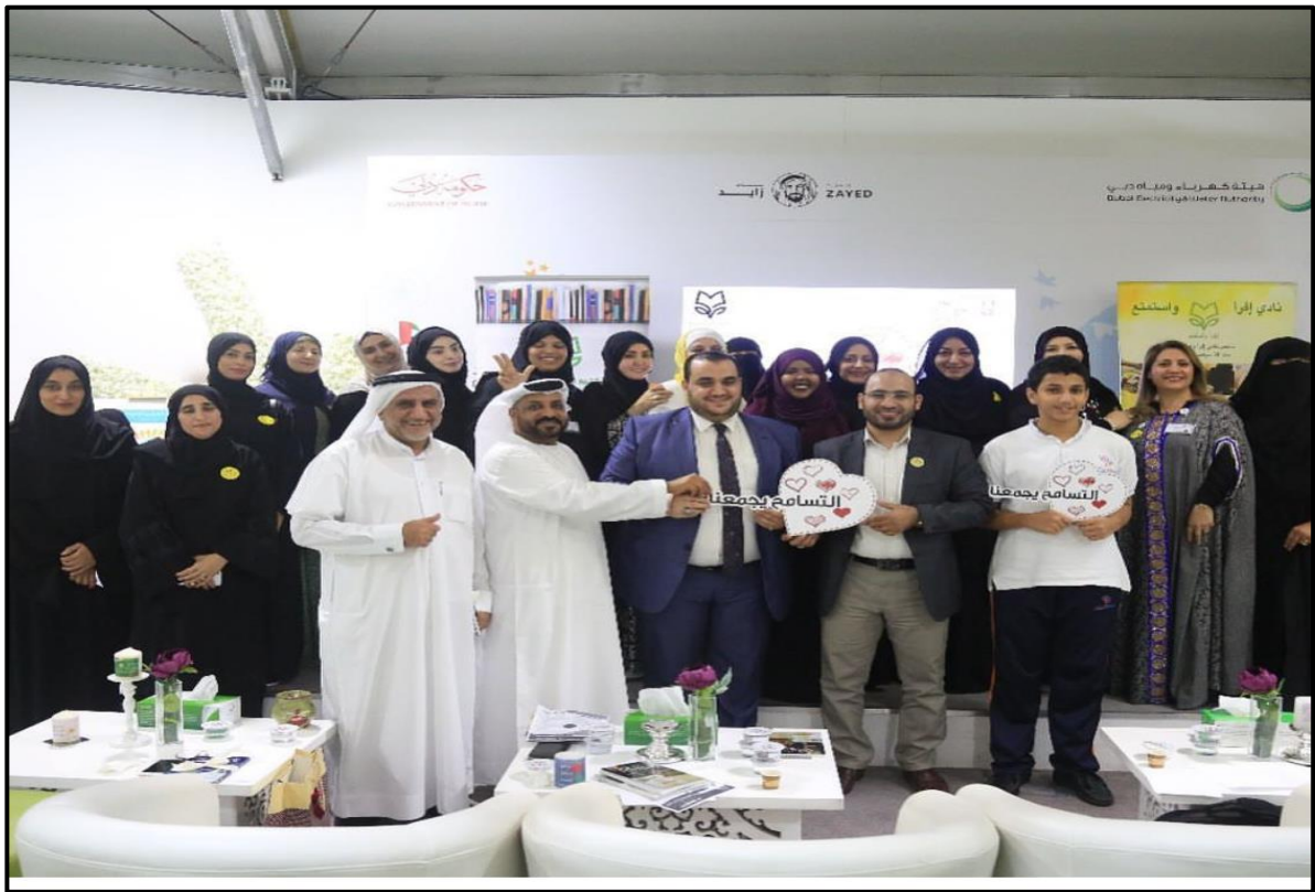
جانب من القاء ندوة حول التسامح ونماذج أثر الحروف العربية. دبي- دولة الامارات.