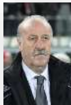
عند منح ركلة جزاء للخصم