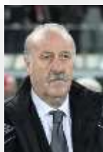
عند تسجيل إسبانيا

كما يمكن، في أثناء مشاهدة مباراة في كرة القدم التقاط إشارة من ملامح شخصيّة المدرب الإسباني "ديل بوسك" (Del Bosque) ووجهه التي لا تتبدّل وفق الظروف، بل تبقى كما هي في حالات الرّيح والخسارة، بغية الإقناع، مثلاً، بأهميّة الإلقاء والتّعبير والتّنظيم في أثناء القراءة.