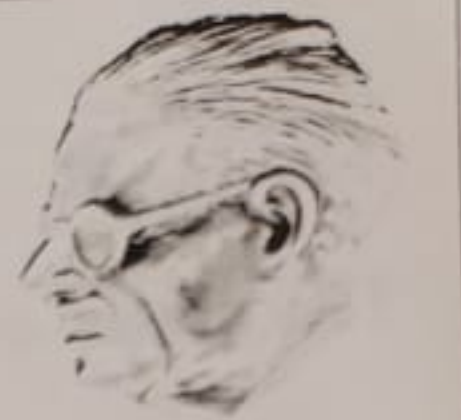
الأربعاء ٤ من مارس ٢٠١٥ العدد ١٥٧١