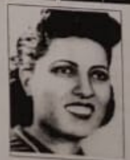
رسوم أضافت للوطن... فأصبحوا عنواناً للعطاء.

اللغة العربية كلية الآداب جامعة القاهرة.