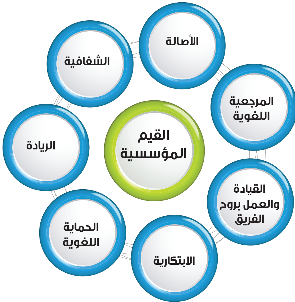
شكل (٢) القيم المؤسسية