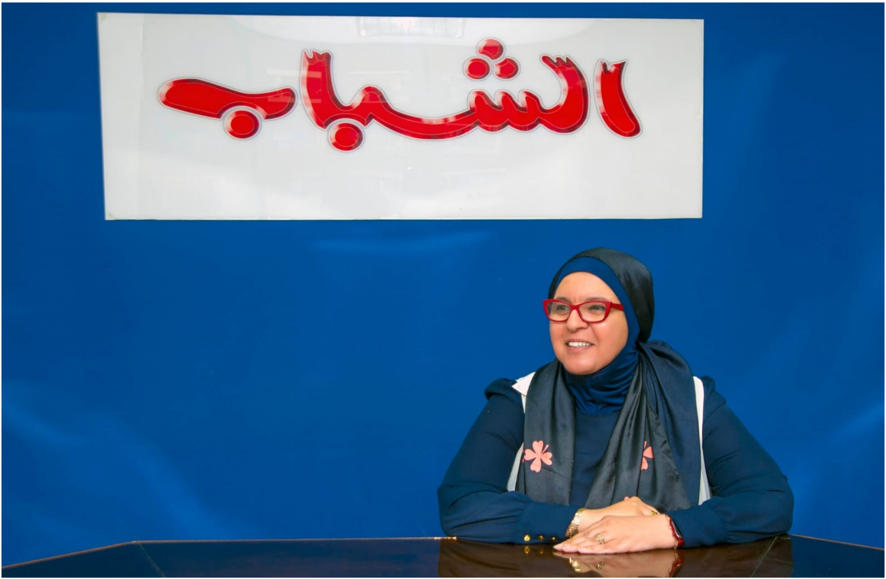
الدكتورة منى دياب كبيرة علماء الذكاء الاصطناعي في شركة ميّتا