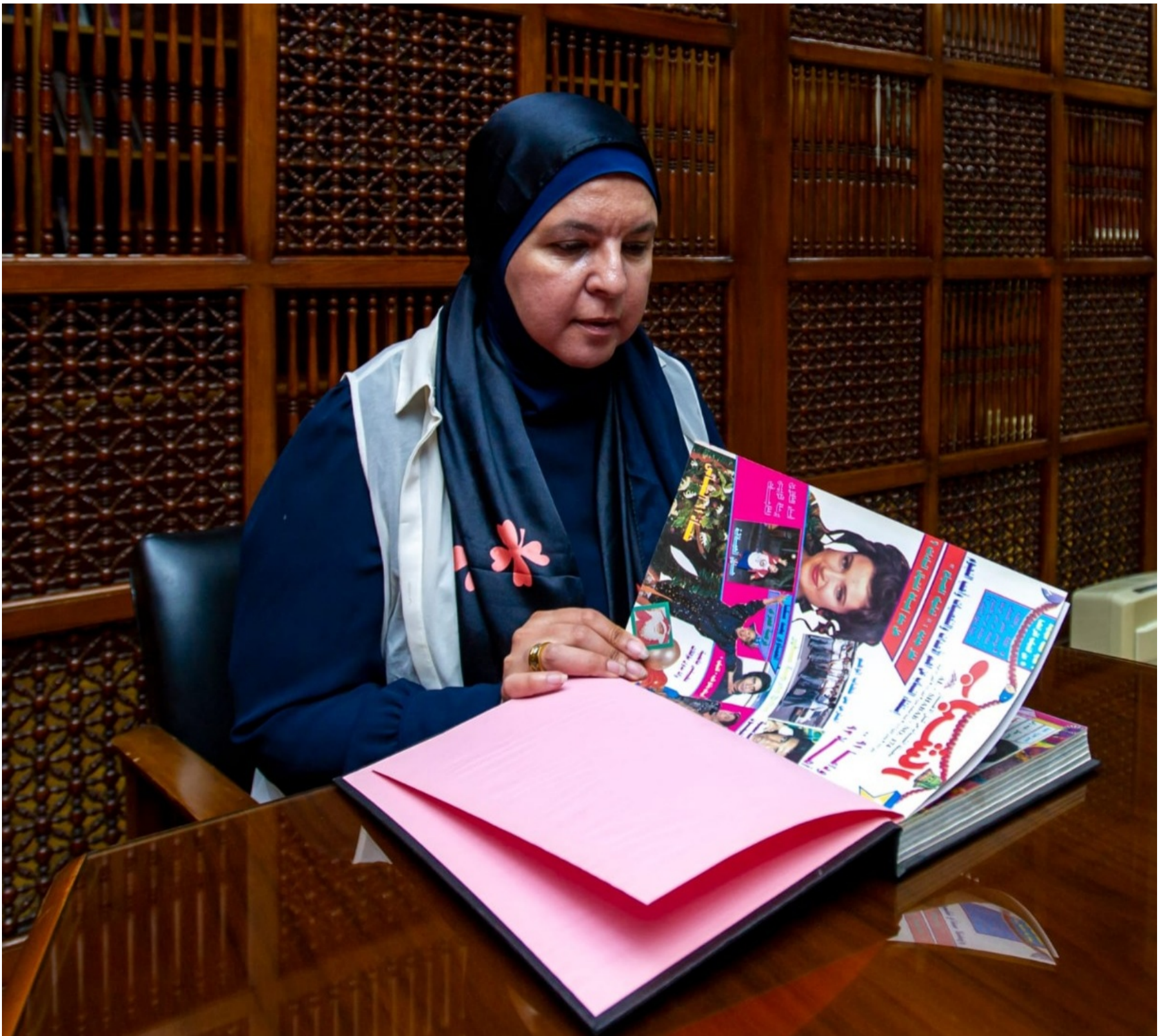
الدكتورة منى دياب كبيرة علماء الذكاء الاصطناعي في شركة ميّتا