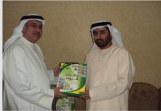
توزيع إصدارات الحملة على العائلات المقيمة