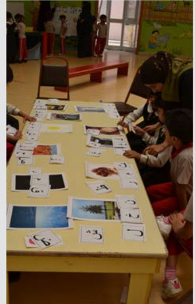
يوم قرائي في روضة التقوى بالعين