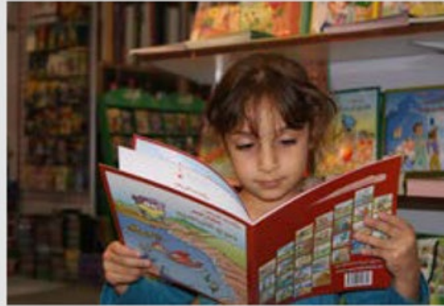
إحدى المشاركات في معرض أبوظبي للكتاب