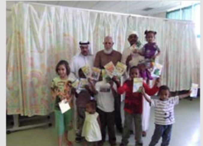
حملة لتوزيع الكتب في مستشفى خليفة