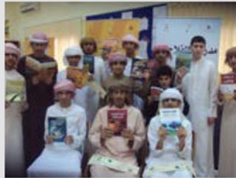
صورة جماعية لأعضاء النادي