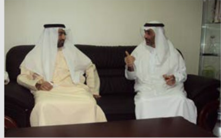
لقاء تنسيقي مع الشيخ عبد العزيز بن علي النعيمي