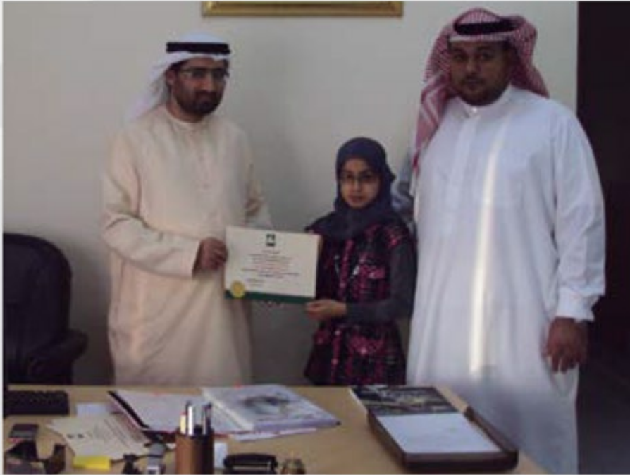
أصغر عضو بالحملة: طالبة من مدينة كلباء