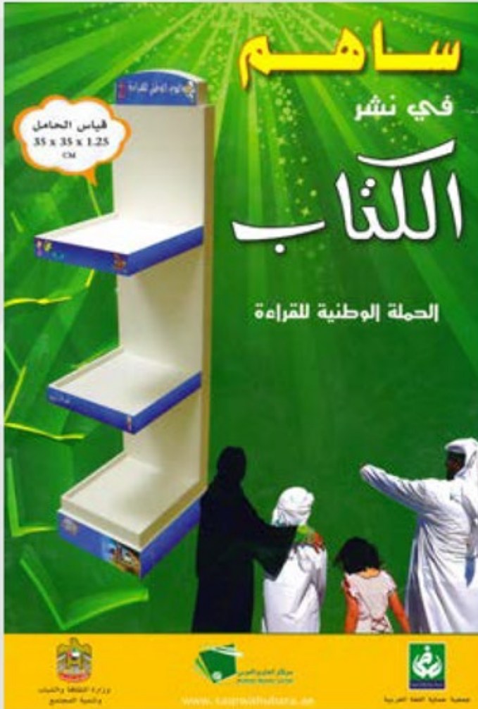
توفير حاملات الكتب