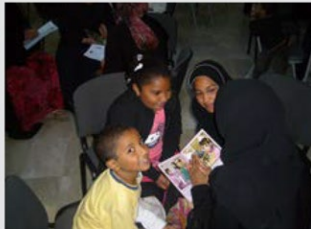
يوم قرائي مع الأمهات