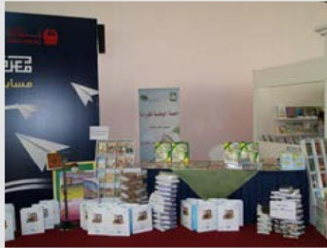
معرض الكتاب في شرطة دبي