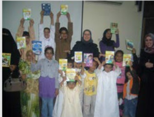
حملة لتوزيع الكتب في مكتبة هور العنز بدبي