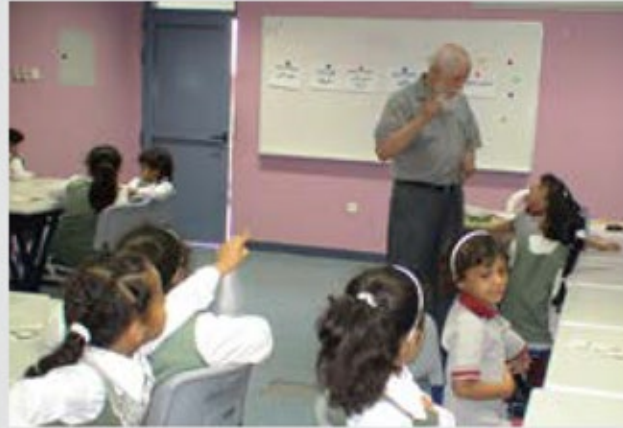
يوم قرائي في مدرسة الزهراء بعجمان