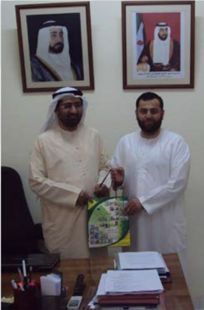
توزيع إصدارات الحملة على العائلات الإماراتية