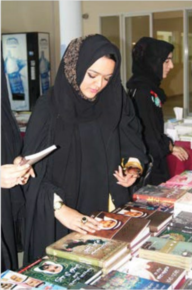
معرض للكتاب الجامعي في جامعة الشارقة