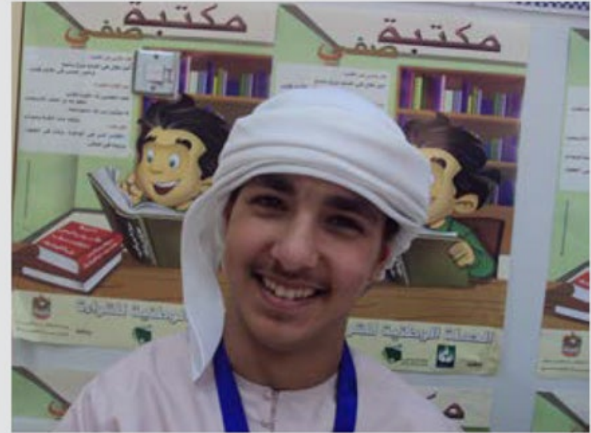
نائب رئيس نادي القراءة في مدرسة الفلاحية