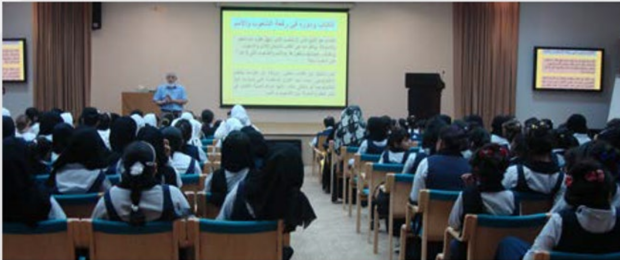
محاضرة في مدرسة ثانوية للبنات