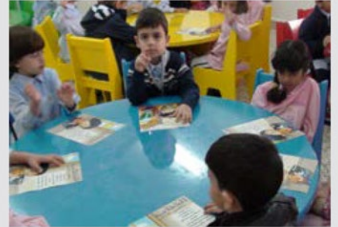
تنفيذ برنامج (الكتاب عالمي الأول)