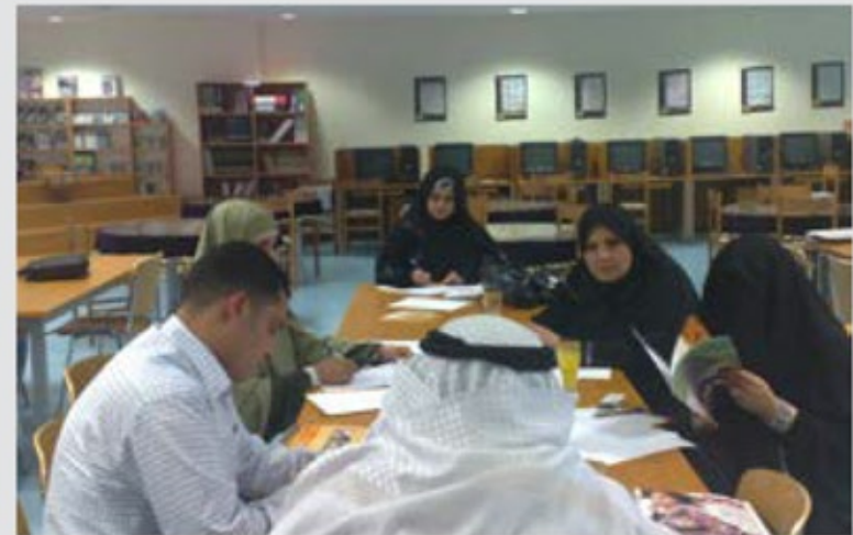
اجتماع مع فريق الحملة في المنطقة الغربية