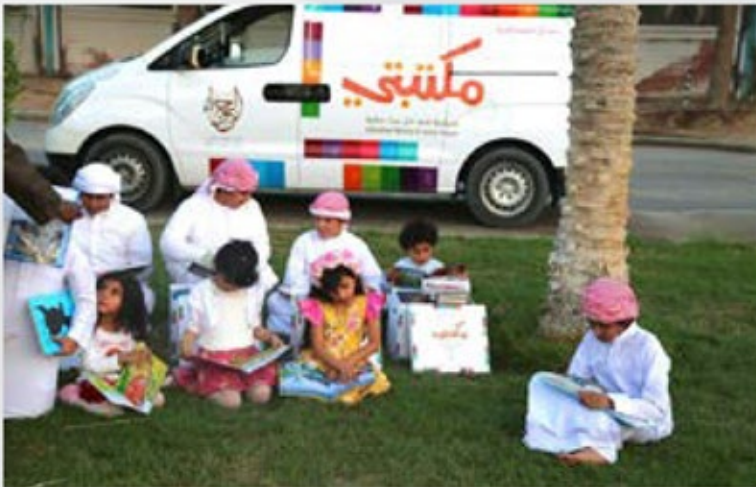
مشروع (مكتبة في كل بيت) في المنطقة الغربية