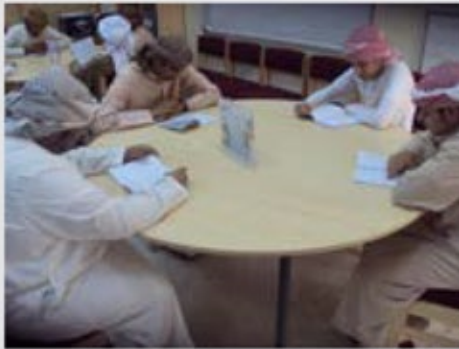
أعضاء النادي في جلسة قراءة