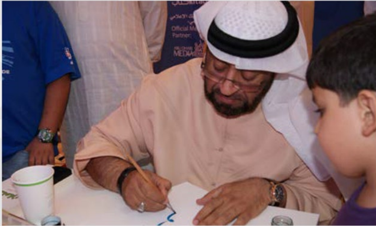
ورشات تعليم الخط العربي - طبعت الحملة كتابا لتعليم الخط 2014