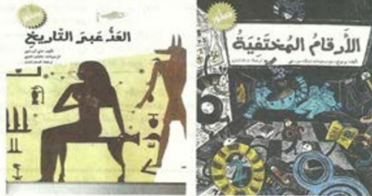
من الإصدارات المترجمة عن الكورية (من المصدر)