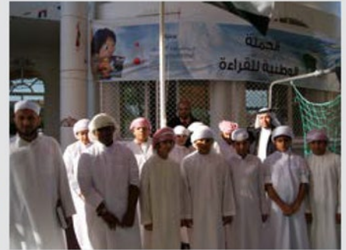
معرض الكتاب في المعهد الديني في دبي