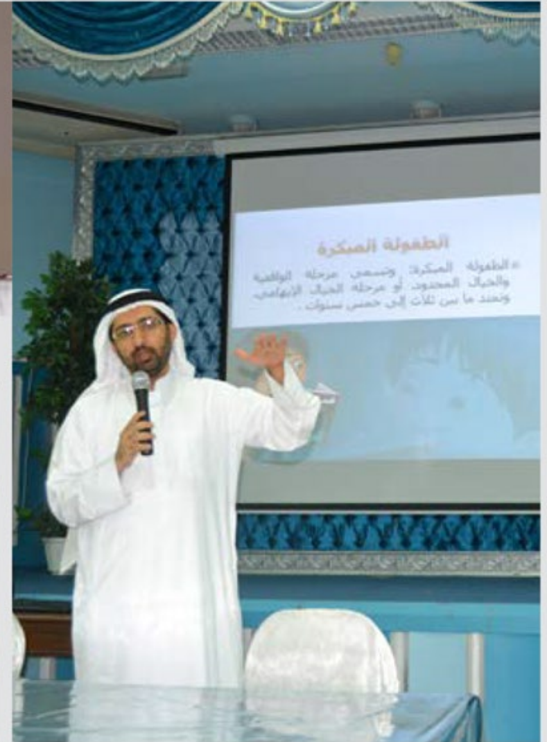
محاضرة للأمهات في روضة التقوى بالعين