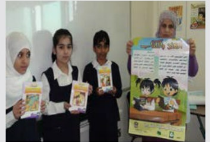
تنفيذ برنامج (أهلا بالكتاب)