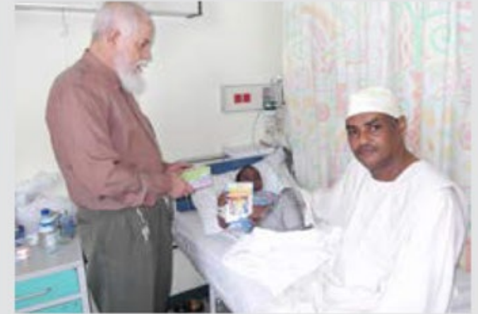
حملة لتوزيع الكتب في مستشفى خليفة