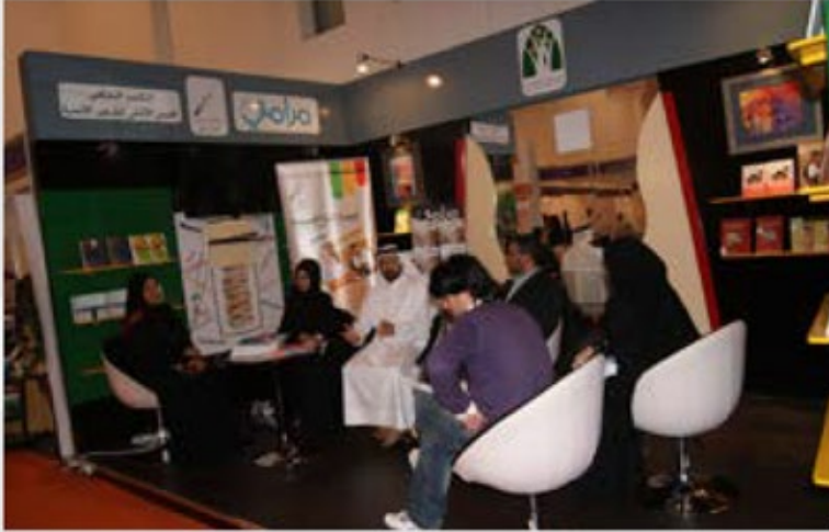
المجلس الأعلى لشؤون الأسرة في الشارقة