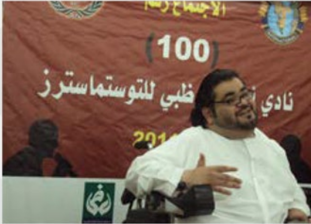
لقاء الخطابة بنادي أبجد