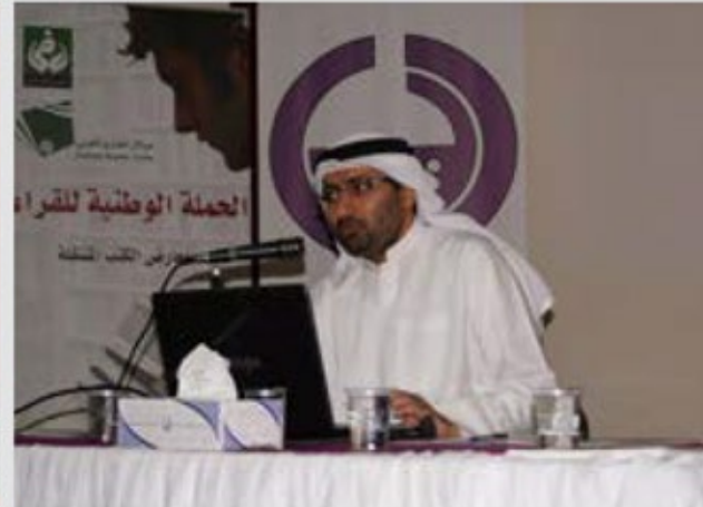
محاضرة في نادي الزيد الرياضي الثقافي