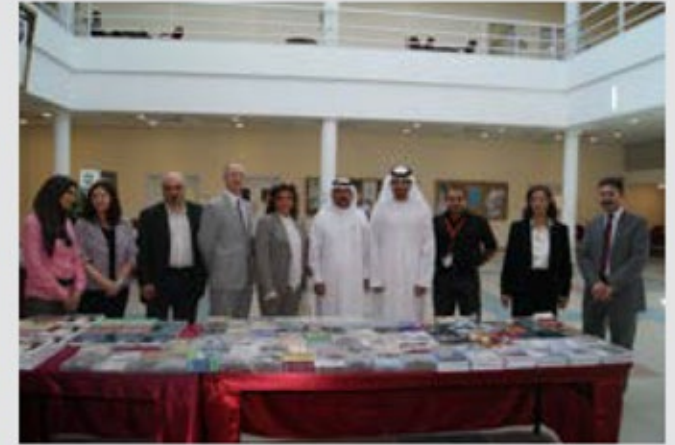
إدارة الجامعة الأمريكية بالشارقة في معرض الكتاب المتنقل