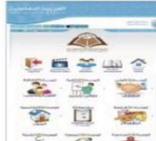
سهولة التعامل تشير الإحصائيات إلى إقبال متزايد وأعداد كبيرة من الولايات المتحدة الأمريكية والمملكة

تطبيق مجاني لمشروع العربية التفاعلية متاح عبر تطبيقات الأجهزة الذكية mobile applications «أيفون، أيباد، سامسونج» حيث نشر تطبيق Interactive Arabic وتطبيقات وخدمات والشراعات نظامي iOS، Android، ويقدم مجاناً على متجر Apple، Samsung، خدمة لغة العربية وحرفاً على نشرها بكل الوسائل، وسيبدأ العمل على قريبا نسخة الحالية وتقديمتها لتسديتين قريبا.