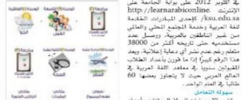
سهولة التعامل تشير الإحصائيات إلى إقبال متزايد وأعداد كبيرة من الولايات المتحدة الأمريكية والمملكة

محتوى محكم استغرق إنجاز محتوى العربية التفاعلية